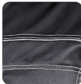
reflexní doplňky reflective accessories elementy odblaskowe