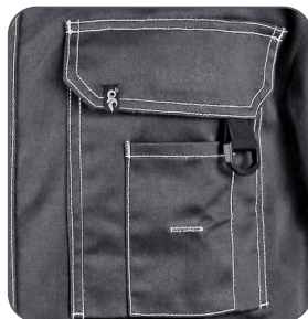
multifunkční kapsy multifunctional pockets kieszenie wielofunkcyjne